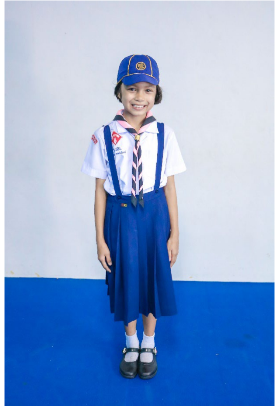
เครื่องแบบลูกเสือหนักเรียนชั้นประถมศึกษาปีที่4-6 (ปกติ)